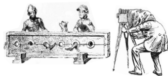
Reglementverst e werden gestraft und ver ffentlicht.