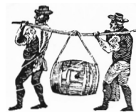
F r Getr nke ist gesorgt!