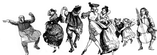
Abends fr hliches Treiben auf der GESINE bei musikalischer Belustigung.