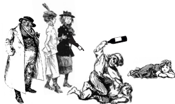
Das Comit  entscheidet bei Streitigkeiten  ber den 1. Platz.